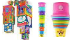
Cubes ou boîtes gigognes