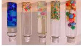
Des boîtes à remplir

Bouteilles remplies d'objets sonores (pâtes, lentilles..) ou visuels (papiers brillants, jolis tissus)