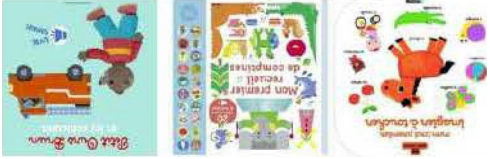
Jeux type Pop'up