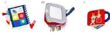
Jouets d'éveil, hochets